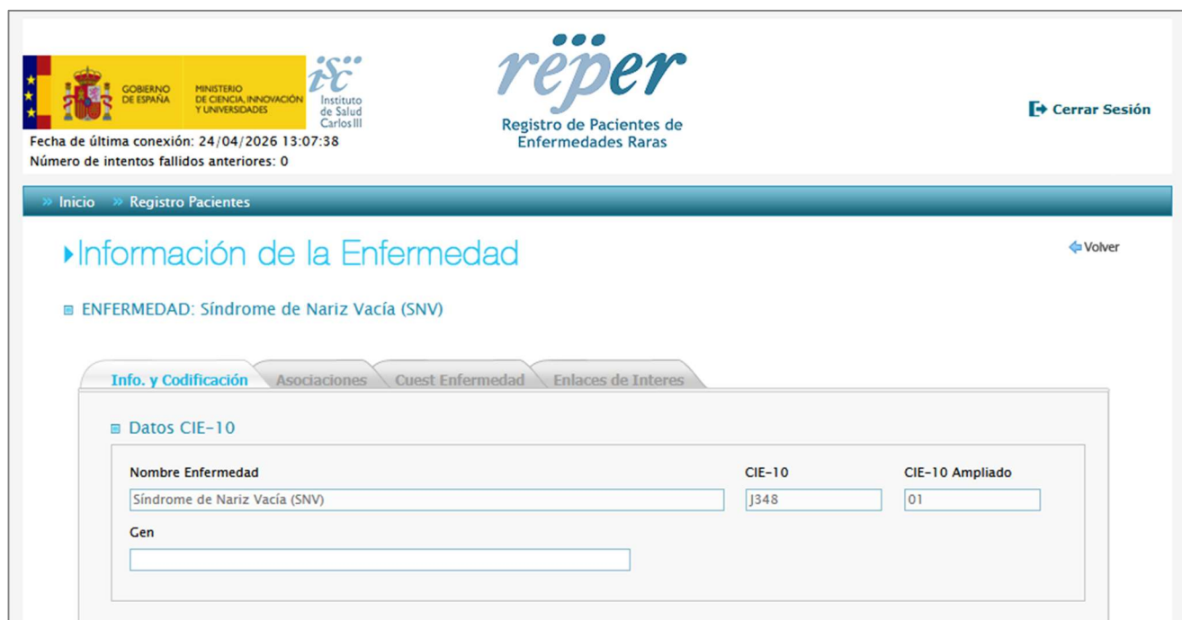
Figura 1. Extracto del RePER mostrando la clasificación del SNV y su codificación asociada

lo que permite su identificación diferenciada dentro del registro (véase Figura 1).