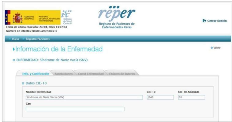
Figura 2. Extracto del RePER mostrando la clasificación del SNV y su codificación asociada

De esta forma, esta enfermedad se mantiene en el RePER bajo la codificación CIE-10: J34.8 y, con el fin de definir una codificación más específica, RePER ha optado por agregar un código CIE-10 Ampliado: 01. Por tanto, el código específico para el SNV en RePER pasa a ser: “J348 01 – Síndrome de Nariz Vacía”.