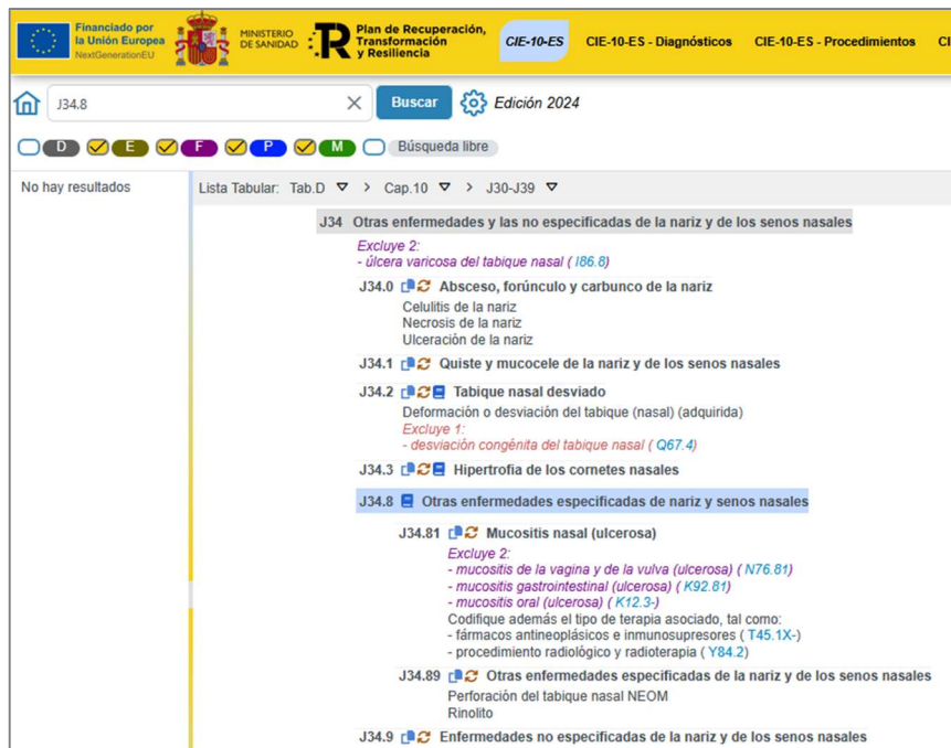
Figura 2. Extracto de la CIE-10-ES mostrando la categoría J34.8 y la J34.89